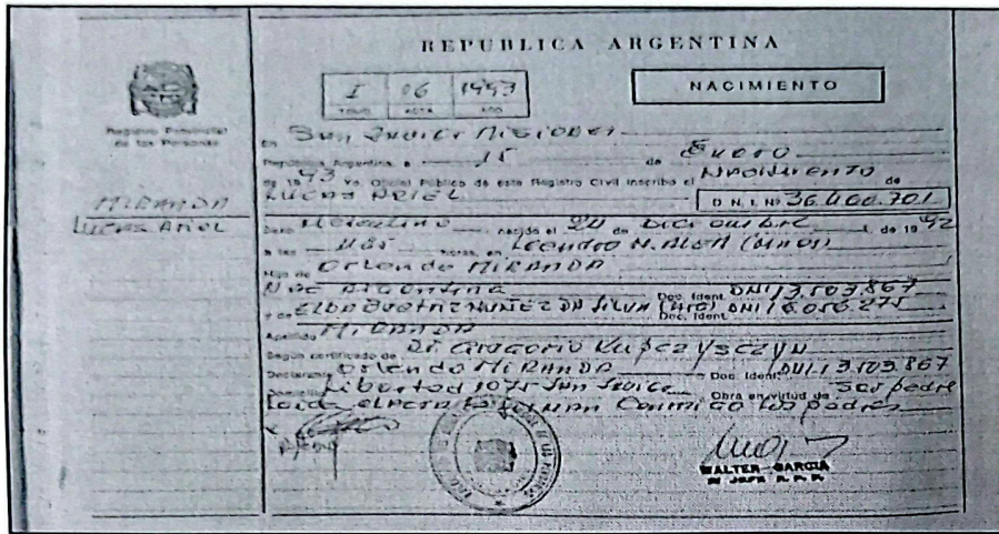
Imagen de Acta: 96